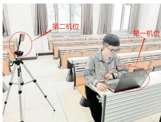
图三：机位布置整体效果