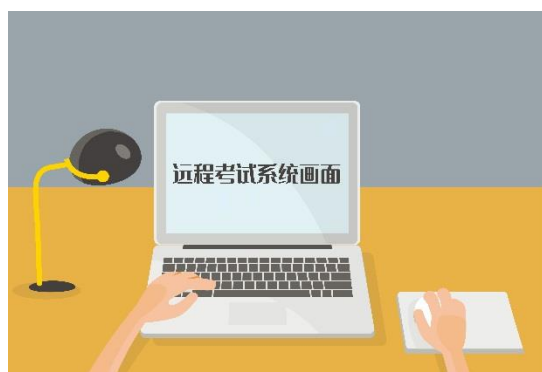
图一：第一机位考生视角

第一机位考生视角的示意图如图一所示，第二机位拍摄效果如图二所示，机位整体布置情况如图三所示，请考生参考。