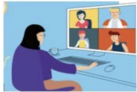
图 2 第二机位拍摄效果示意图