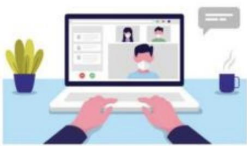
图 1 第一机位示意图